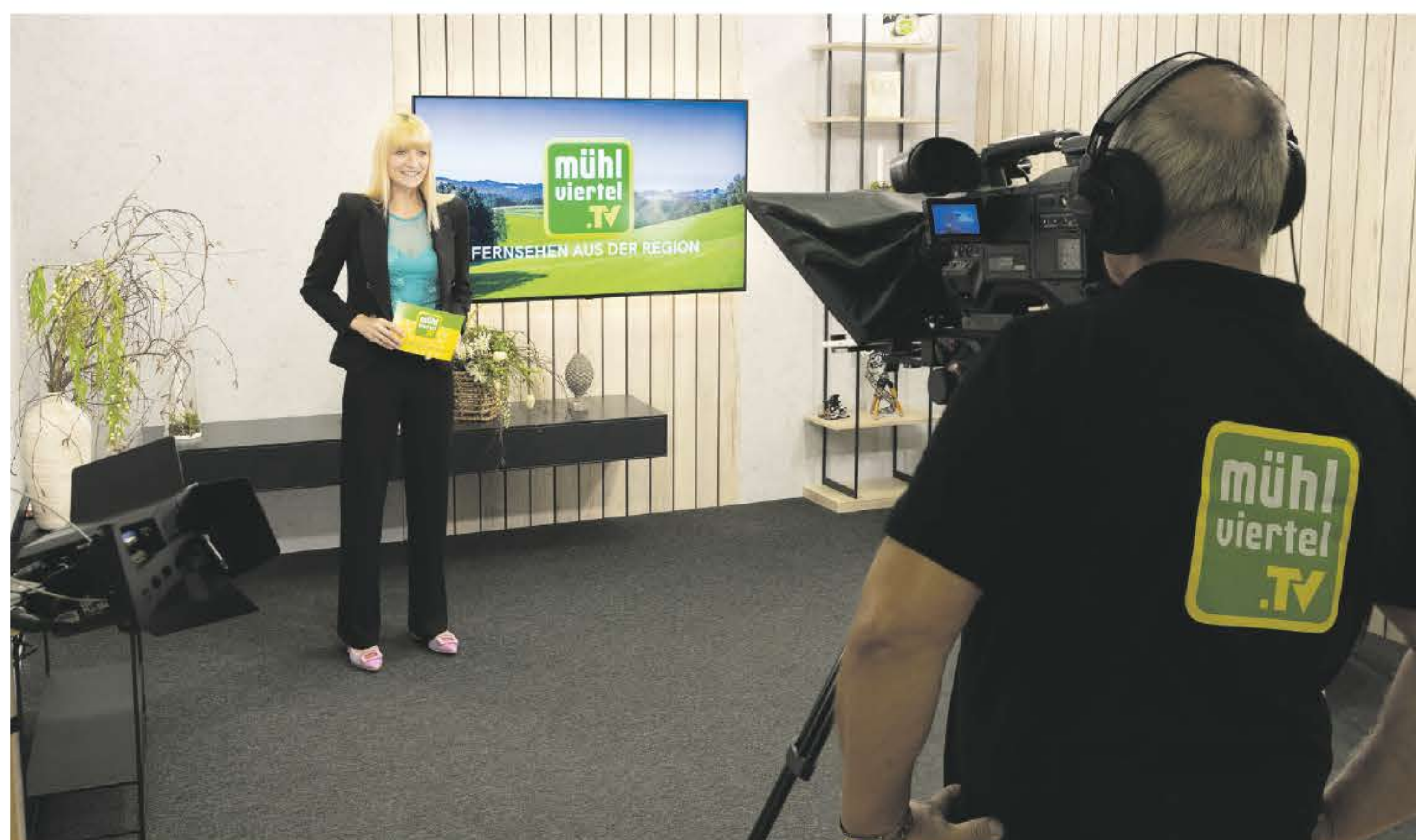
Aufnahme im Mühlviertel.TV-Studio in Freistadt